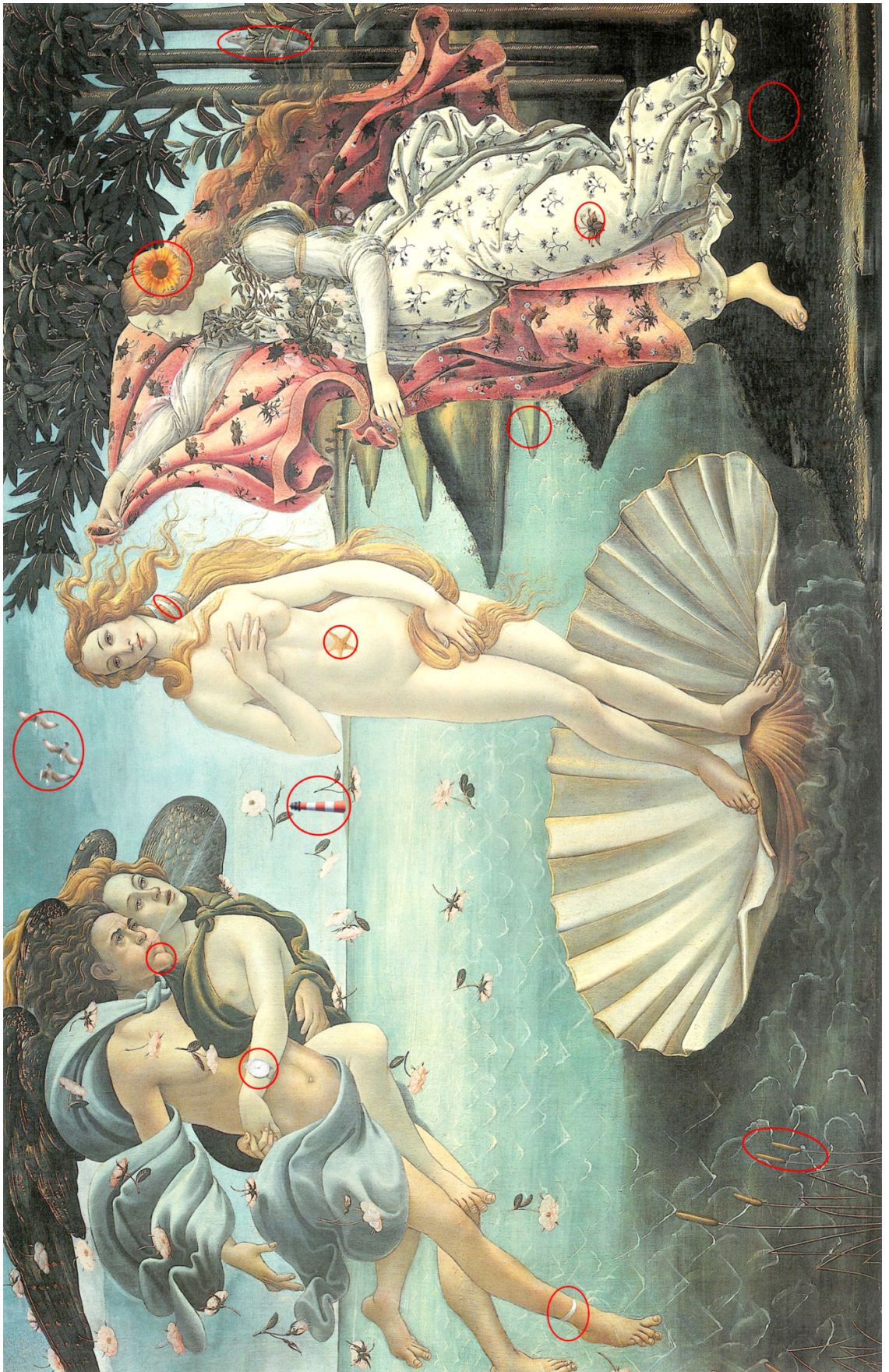
Sandro Botticelli: De geboorte van Venus, ongeveer rond 1483, tempera op paneel, 173 x 279 cm Galleria degli Uffizi, Florence